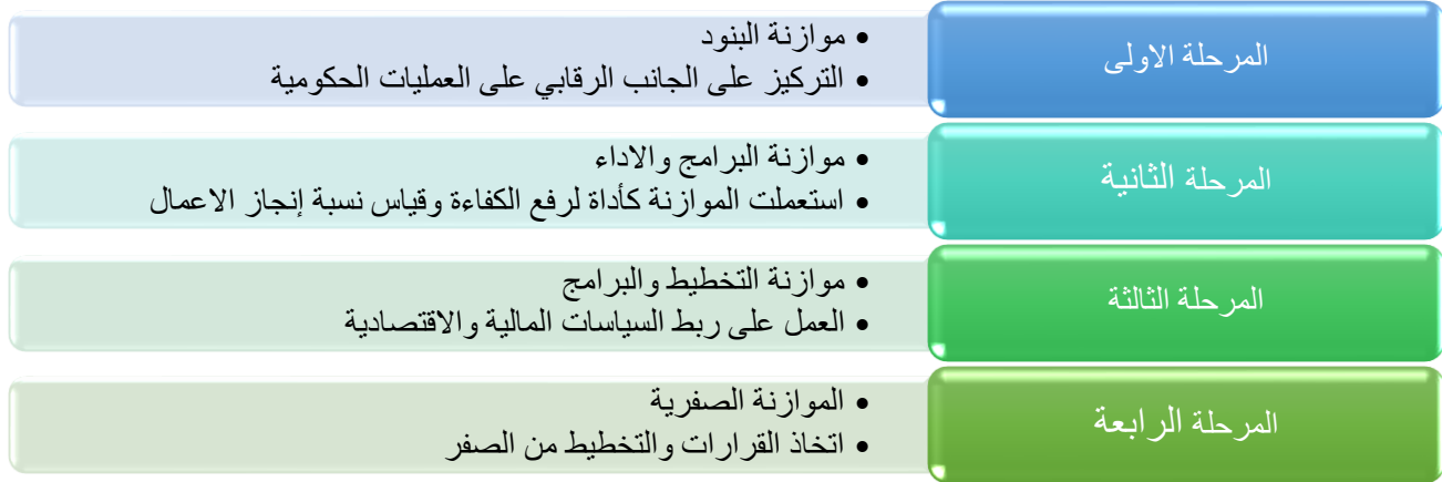
شكل (2) مراحل تطور الموازنات

تنفيذ العديد من البرامج والأنشطة وسميت بذلك موازنة التخطيط والبرامج.