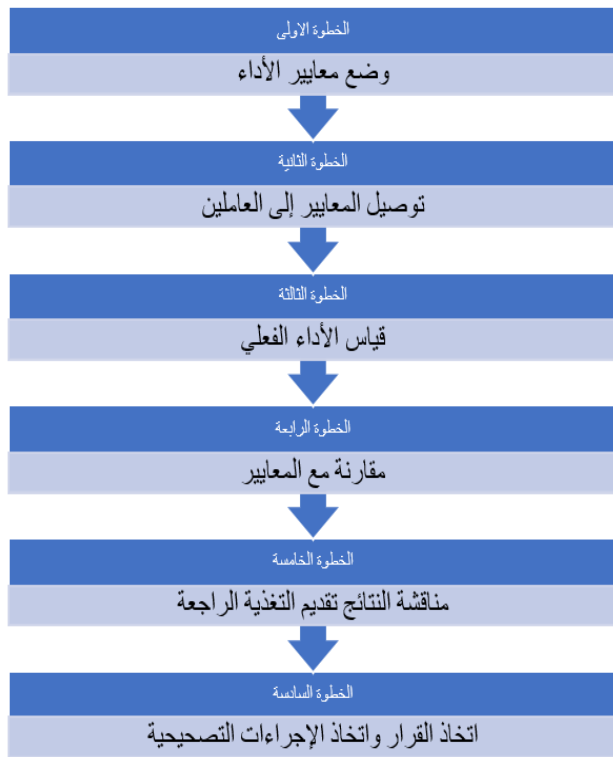
الشكل (1) مراحل تقويم الاداء

ويمكن توضيح الخطوات السابقة من خلال الشكل الآتي: