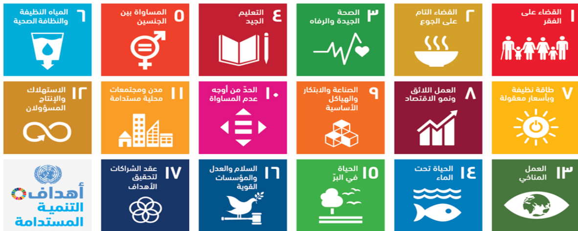
الشكل رقم (2) أهداف خطة التنمية المستدامة (2015 – 2030).

تُعدّ الطاقة المتجددة أحد أهم ركائز عملية التنمية لجميع البلدان، بالأخص في ظل التوجهات الدولية الرامية للتحول من المصادر الناضبة للطاقة إلى المصادر المتجددة (حمادي وآخرون، 2022: 2). وكذلك فهي تمثل أحد المتغيرات الرئيسة لتحقيق تنمية شاملة مستدامة، من خلال سعي المجتمعات إلى تأمين استهلاك الطاقة النظيفة بأسعار معقولة (نعمة وآل دهام، 2022: 41). ويمكن تعريف الطاقة المتجددة بصورة عامة على أنها الطاقة التي يتم الحصول عليها من خلال استخدام المصادر الطبيعية مستمرة للتجدد وغير الناضبة، وبالتالي دعم الفكرة الأساسية للتنمية